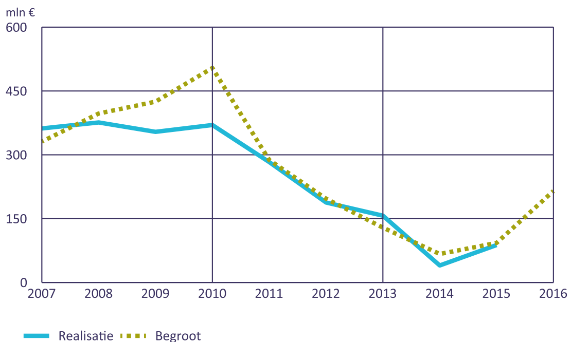
Figuur 2 Ontwikkeling rijksuitgaven aan inburgering