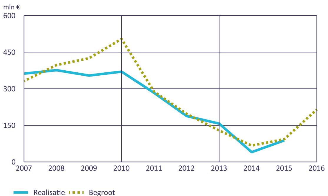
Figuur 2 Ontwikkeling rijksuitgaven aan inburgering